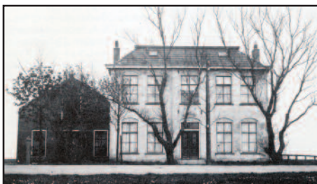
De maresjeseekazerne by Harkesyl, boud yn 1894. Lofts de hynstestallen.

Yn 1895 wie der in grut trelit. It fabryk krige in ynspekteur op besite, de hear Loben-Sols. Dizze man moast der op tasjen dat de wet op 'vrouwen- en kinderarbeid' wol goed tapast waard. Wat ûntduts dy man? De frou fan de bûtermakker help mei by it skjinmeitsjen. No dat koe gjin kant út. Yn Wytmarsum wie yn 1894 in brigade maresjesees delstrutsen om de rebelske reade Friezen yn de stokken te hâlden (Yn Den Haach wie it regear