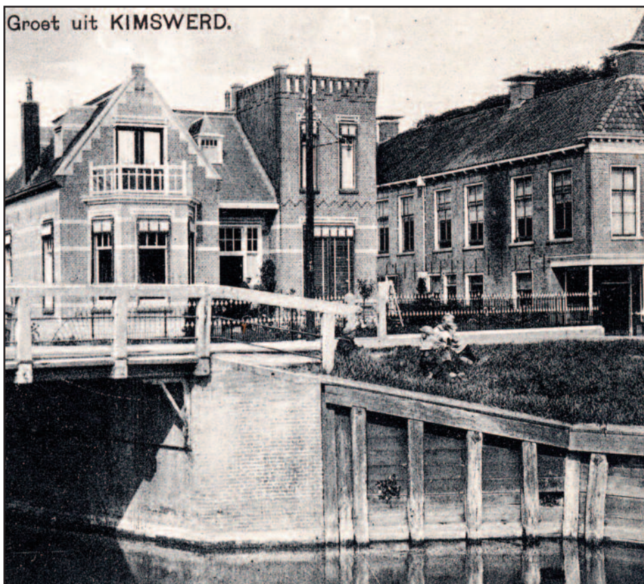
Rjochts Kafé Unia, no kafé "Greate Pier"

Jo koene it net sjen, mar jo koene der fan alles mei. Jo koene ljocht meitsje, dingen waarm meitsje, mar ek motors op rinne litte. It wie wol wat gefaarlik as jo oan in bleate stroomtried kamen, mar jo hiene gjin smoargens. De lampen brûnden doe noch op peteroalje en dat wie tige brângefaarlik. Alle jierren wie der wol in brân yn ús doarp