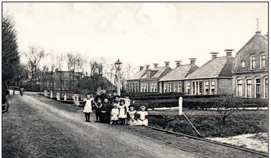
De rige huzen op it plak wer 't foarhinne "Bonga-State" stie. De slotsgrêft is der noch. Rjochts, heal op dizze foto, it gebou fan "de Vereniging". Hjir is pionierswurk dien op it gebiet fan fokkerij fan kij en hynders. Fierder wie it in ark- en reau koöperaasje mei in stoomlokomobyl en in terskmaschine. Yn 'e foargevel twa Makkumer tegelablo's, ien in hynder en de oare mei in ko.